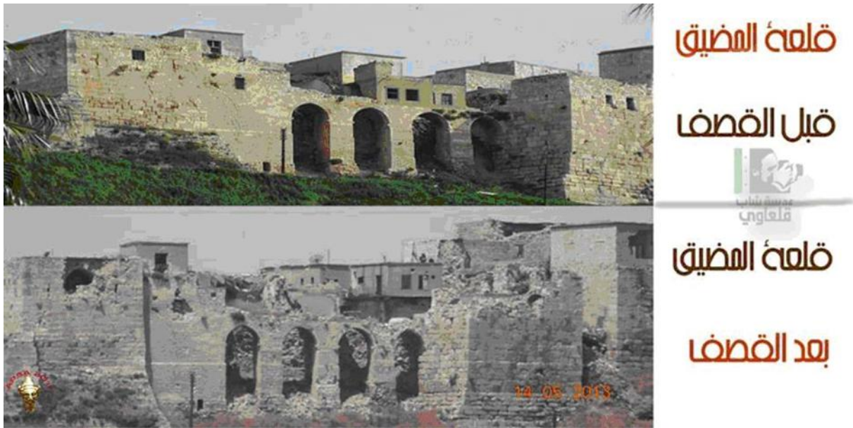
FIGURA 1. Antes y después de Qalat al-Mudiq, la parte medieval de/Apamea del orontes Se aprecia que es una foto pro-régimen oficialista, por la bandera que emplean en el lateral.

2. En Alepo, la ciudadela construida por Saladino se vio afectada por fuego de mortero y armas automáticas. Los rebeldes defienden la tesis de que los disparos provenían de armas accionadas por las fuerzas del régimen 12 . Sin embargo, nuestras informaciones apuntan a una destrucción compartida a lo largo de muchos meses.